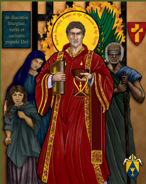
phụng vụ - Lời Chúa – bác ái