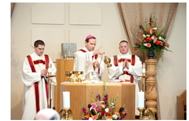
phụng vụ Bàn Thánh